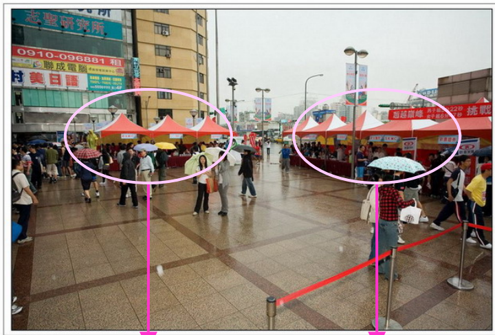
Canon EOS 5D F6.3 1/250s ISO640 0.3EV