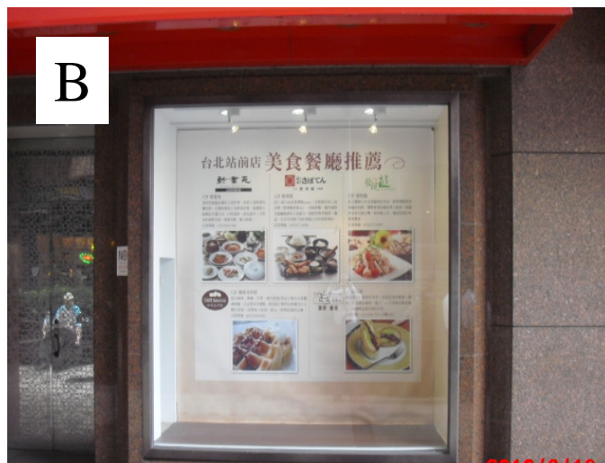
B 忠孝西路 與大亞百貨交會口