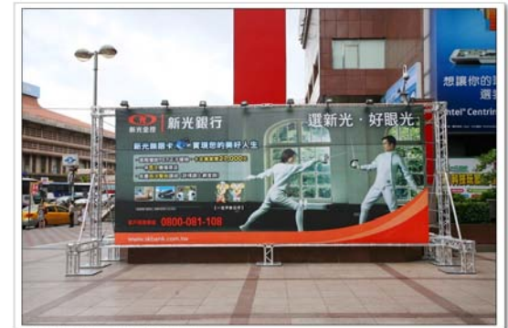
Canon EOS 5D Mark II 24105mm 1/4s ISO800 F8.0 1/250s 100250