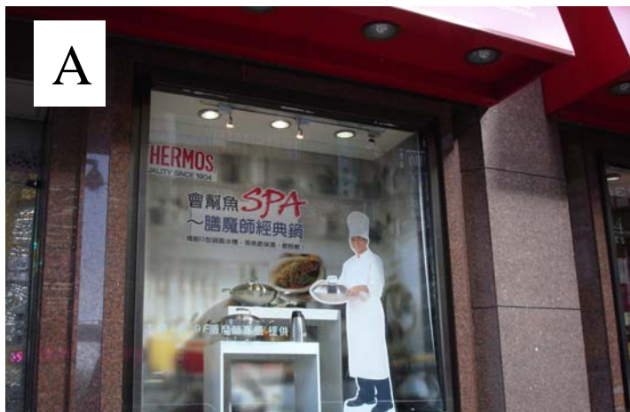
A 忠孝西路與館前路交會口