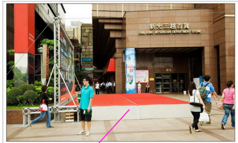
Canon EOS 5D F4.0 1/500s ISO720 0.3EV