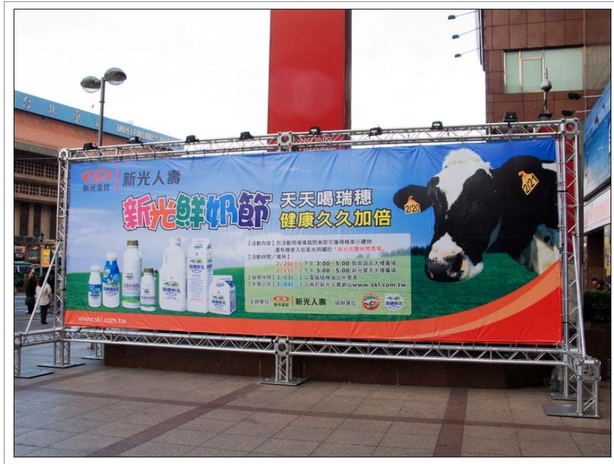
Canon PowerShot G9 FS 6.1/125s ISO200 0.3EV