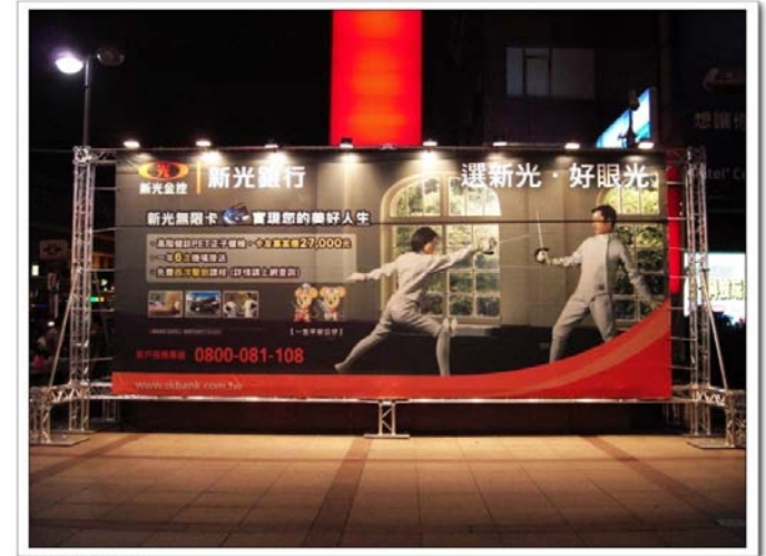
EX21050 F2.8 1/60s ISO800

Truss 支架不定期搭設，若有搭設，廠商可免費使用 可直接覆蓋原帆布，活動後拆除該日活動帆布即可 若拆除原帆布，活動結束請回復原狀 若無回復原狀，衍生之掛回費用將由租借單位支付