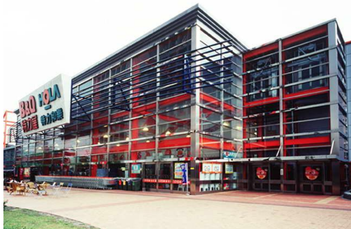
B&Q與特力和樂家居生活館