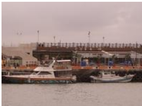
淡水漁人碼頭-50分鐘