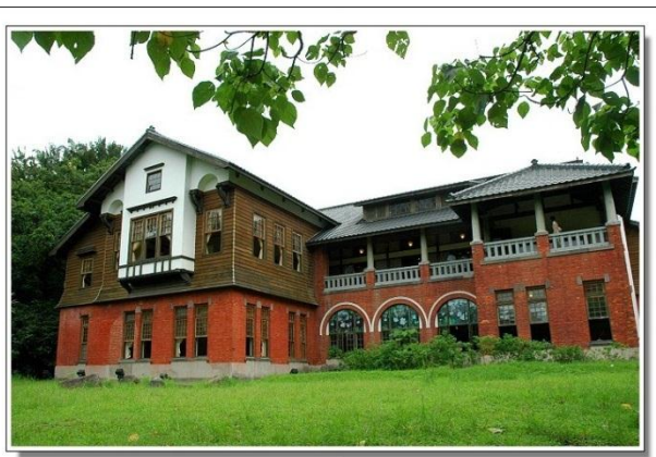
北投溫泉博物館-25分鐘