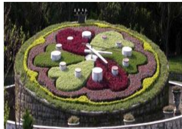
陽明山國家公園-20分鐘