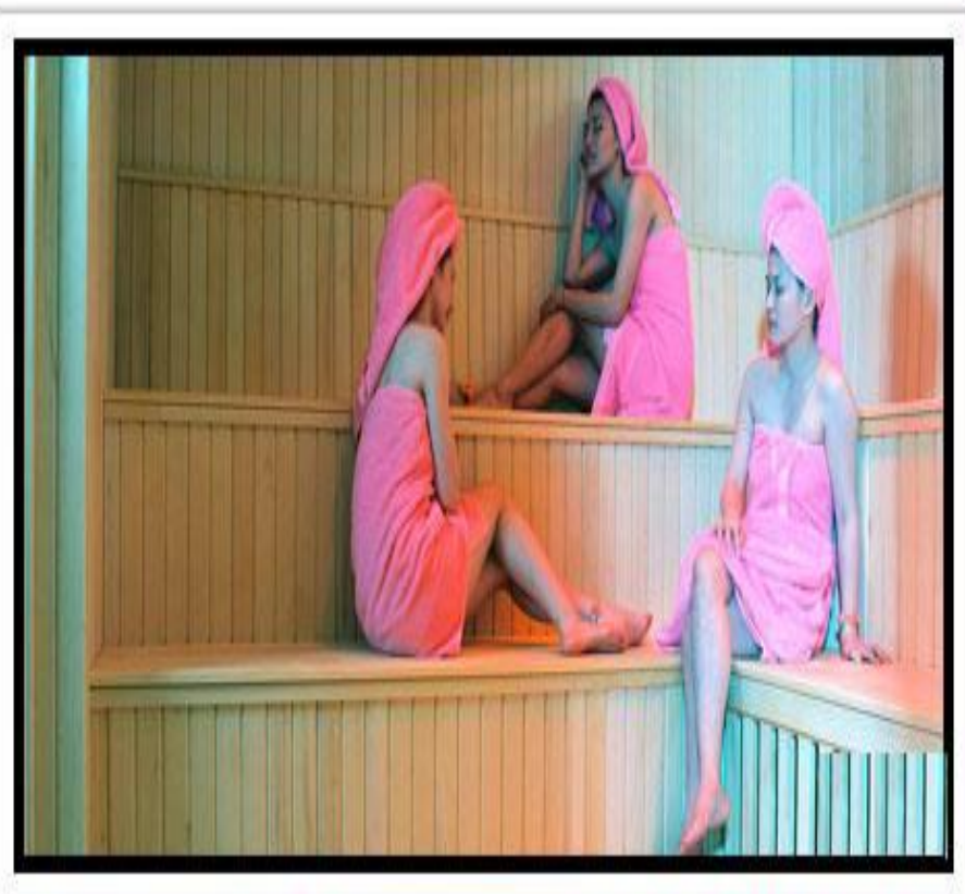
男女賓區-蒸氣室、烤箱